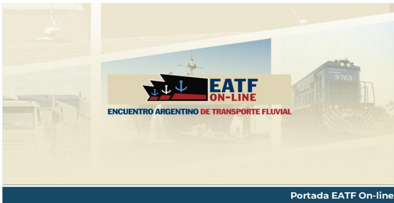
Portada EATF On-line

El Encuentro Argentino de Transporte Fluvial cuenta con su propia plataforma multimedia alojada en su canal de YouTube, donde se transmiten en vivo jornadas de actualización con respecto a temas relacionados con la actualidad portuaria, de las vías navegables y los factores de impacto en las mismas.